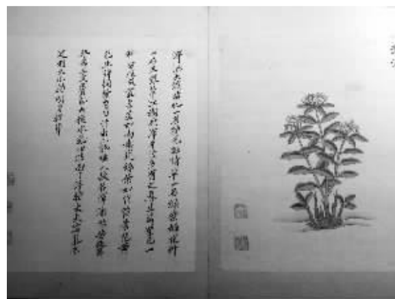
明杨荣起抄 周淑祜、周淑禧彩绘本《本草图谱》一页