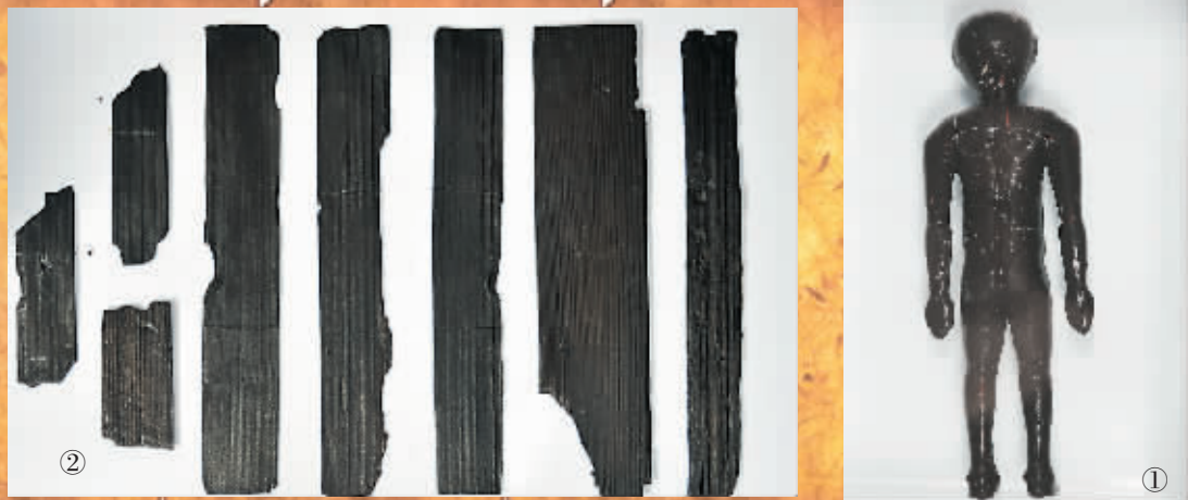
图①:出土的人体经穴漆漆人像。 图②:出土的部分简牍。

近日,成都文物考古研究所通报了对成都“老官山”汉墓抢救性考古发掘的成果。“老官山”汉墓目前出土文物共计620余件(不含简牍),其中漆器240余件,陶器130余件,木器140余件,铜器(含钱币)100件。此外还出土了920余支简牍,据考古专家分析,其中疑似含有失传已久的扁鹊派医书。