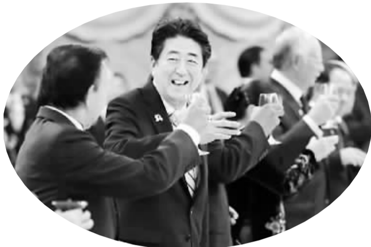
13日,日本东京,在首相官邸举行的东盟国家特别首脑会议欢迎晚宴上,安倍晋三(左二)举杯致辞。安倍政权13日颁布了备受批评和质疑的《特定秘密保护法》。

在中非,法国就面临许多困难。法国在中非开展军事行动遭遇的首要问题,就是如何处置那些被缴械的反政府武装人员,如处置不当,这些人仍将是影响中非国内局势稳定的重要因素。而在法国国内,民众对中非行动的信心开始不断下降。民调显示,“红蝴蝶”行动正式启动当天,有1/2的受访者对奥朗德表示支持。然而,14日的最新统计结果显示,支持率已骤降到44%。此外,如何抽身也是一大难题。法国年初出兵马里,至今未能全身而退。中非冲突双方力量强大,