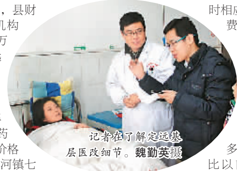
记者在了解定远县基层医改细节。