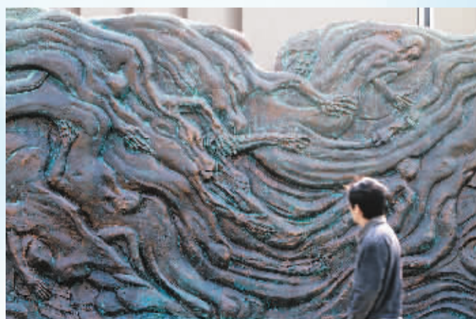
12月11日，位于侵华日军南京大屠杀遇难同胞纪念馆墓地广场内的南京大屠杀主题浮雕墙改造工程通过验收，对外开放。