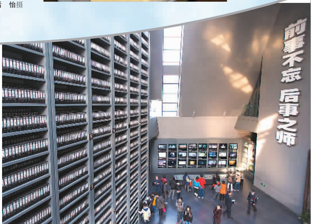
12月11日，民众在侵华日军南京大屠杀遇难同胞纪念馆内参观。