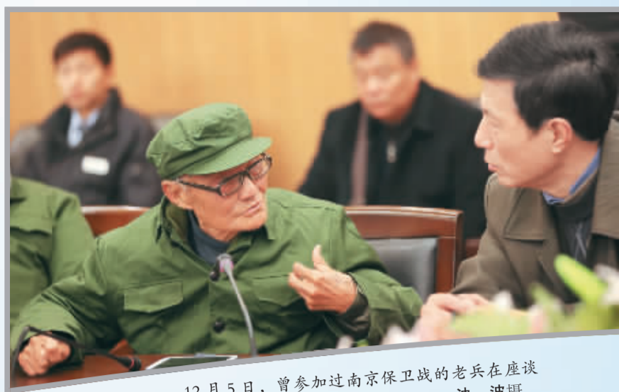
12月5日，曾参加过南京保卫战的老兵在座谈会上追述当年的亲身经历。