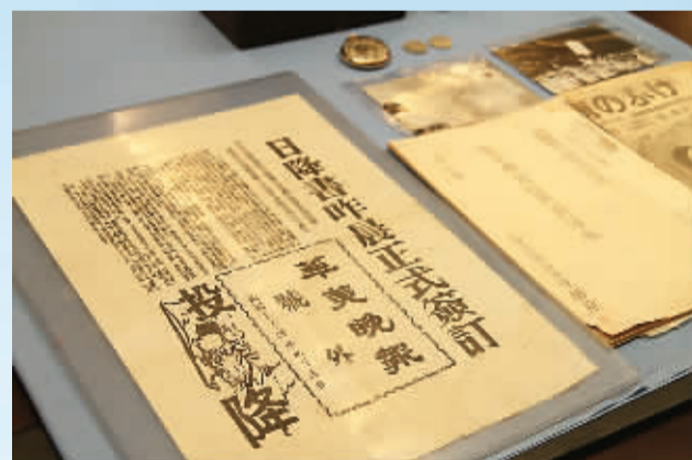
侵华日军南京大屠杀遇难同胞纪念馆展出的部分捐赠文物。