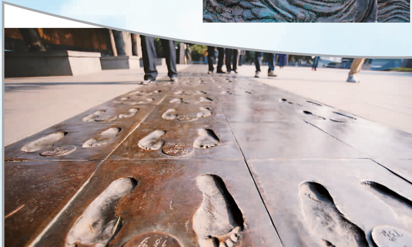
近日，民众在侵华日军南京大屠杀遇难同胞纪念馆内的“幸存者脚印铜板路”参观。