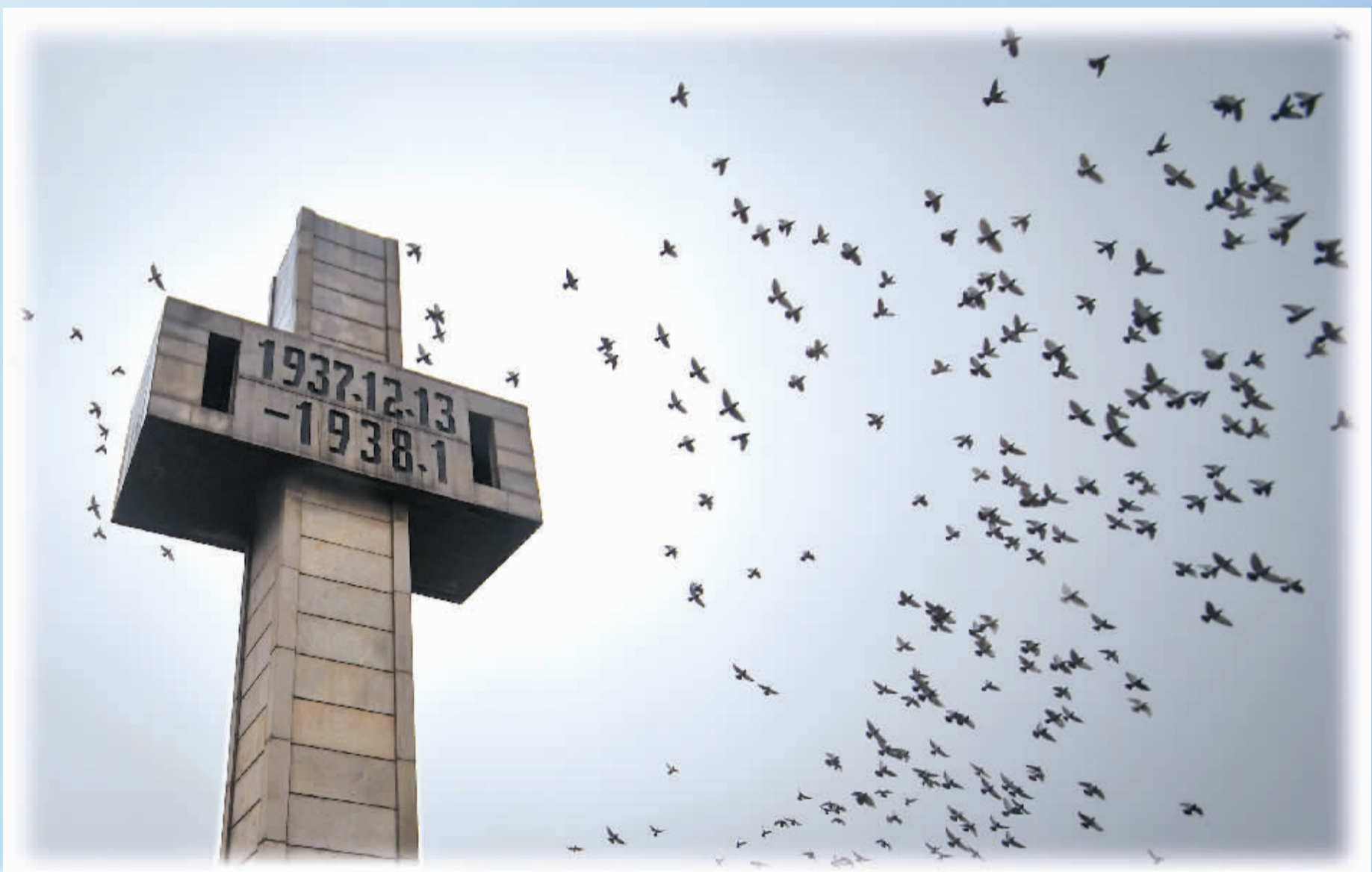
今天的纪念就是为了牢记历史教训，防止历史悲剧重演。图为侵华日军南京大屠杀遇难同胞纪念馆内的纪念碑。