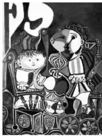
两个小孩 巴勃罗·毕加索