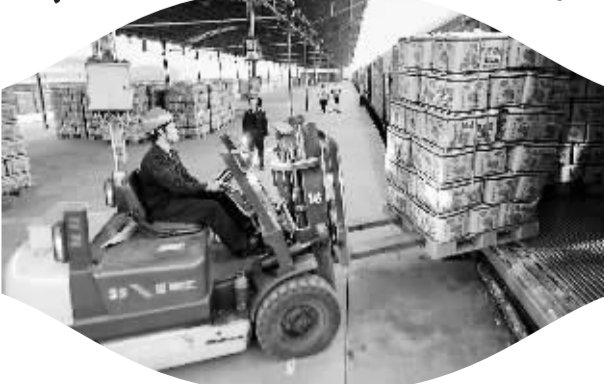
12月11日，“百色—北京果蔬绿色专列”正式开通，这是我国首条“南菜北运”铁路绿色通道，将结束我国“南菜北运”主要依靠公路运输的历史。图为工人将果蔬装车。