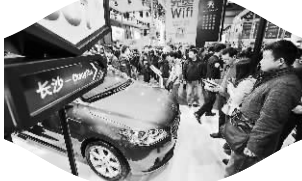
12月12日，第九届中国（长沙）国际汽车博览会在湖南国际会展中心拉开序幕。本届车展共展出700余台新车，展览面积达10万平方米。图为车展第一天吸引了众多消费者前来参观。