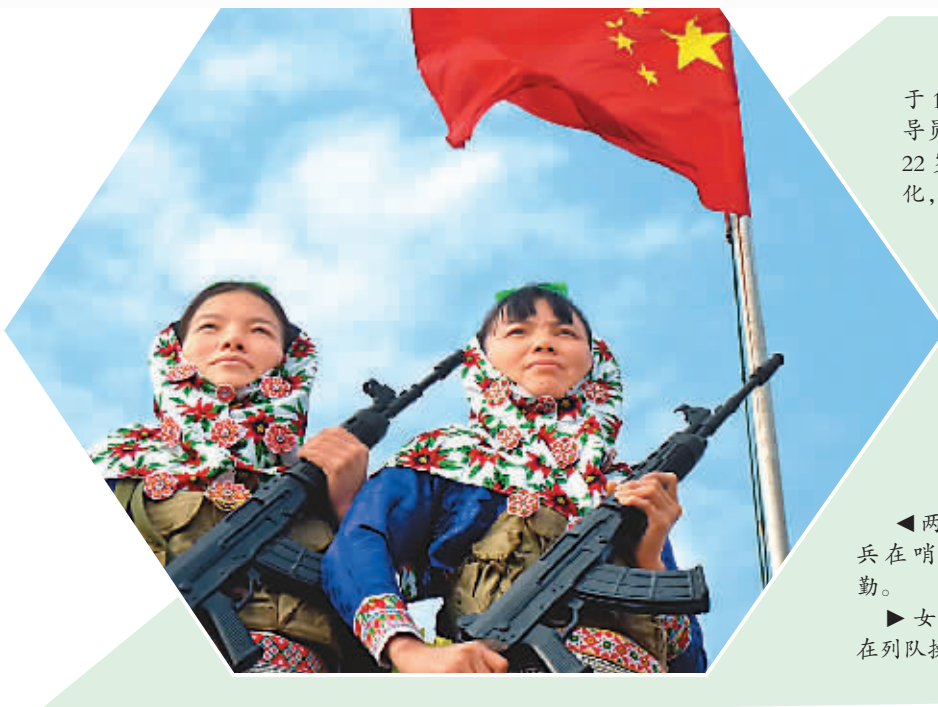
▲两名女民兵在哨位上执勤。 ▶女民兵们在列队操练。

近日,一家以传统国学文化启蒙为主要课程的童学馆——长沙金源童学馆开课授课。孩子们利用周末来这里学习德行、数理、园艺、诗文、武术等,感受国学文化。图为孩子们在课间打童学拳。