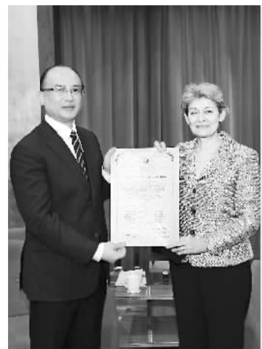
联合国教科文组织总干事为深圳市长许勤颁“全球全民阅读典范城市”证书

从《人文颂》出发,从“全球全民阅读典范城市”出发,这座城市的文化远航有了新的视野与动力,她所蕴含的文化能量,将伴随着城市发展的铿锵足音,在“高贵的坚持”中持续迸发,永葆生机与活力。