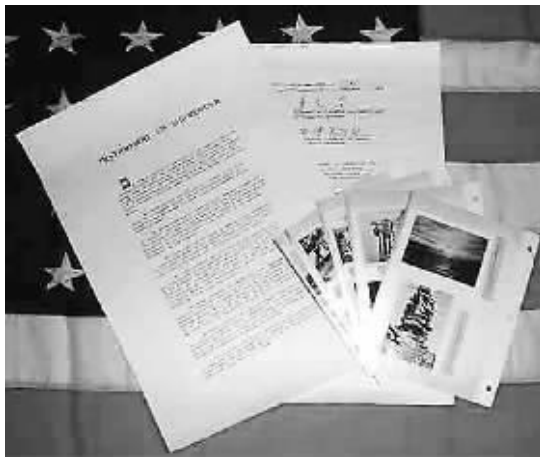
日本降书(复制标本)和1945年拍摄的原照片(延陵博物馆藏)