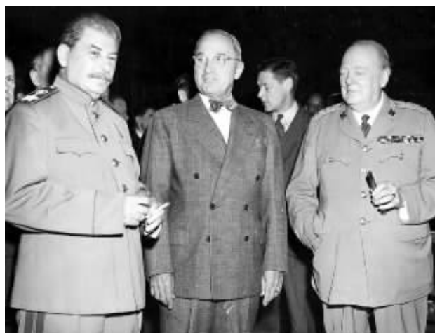
参加波茨坦会议的斯大林(左)、杜鲁门(中)和丘吉尔。