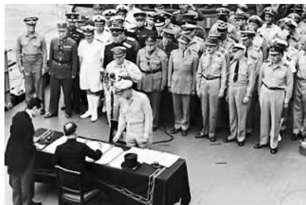
1945年，日本签署《无条件投降协议》，并同意接受《波茨坦公告》。