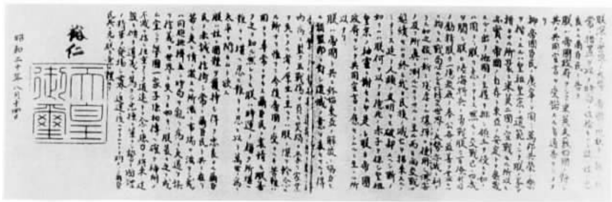
日本降书中明文规定执行《波茨坦公告》资料图片