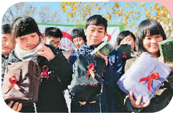
▲河南省灵宝市疾病预防控制中心的志愿者展示防艾标志红丝带。 ▲山东聊城大学大学生们展示收到的“红丝带”健康礼包。

12月1日是第26个“世界艾滋病日”,今年活动主题是“行动起来,向‘零’艾滋迈进”。各地纷纷开展主题宣传活动,呼吁全社会消除歧视,关爱艾滋病病人。 据国家卫生计生委统计,今年1至9月新发现的艾滋病病毒感染者和病人中,有89.9%是通过性行为感染的。