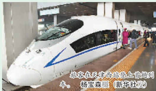
旅客在天津西站登上首趟列车。

本报秦皇岛12月1日电 (记者严冰) 天津至秦皇岛高速铁路今天正式开通运营,天津至秦皇岛的最快旅行时间由2.4小时压缩至1小时11分。 津秦高铁运营里程287公里,设计时速350公里,初期运营时速300公里。