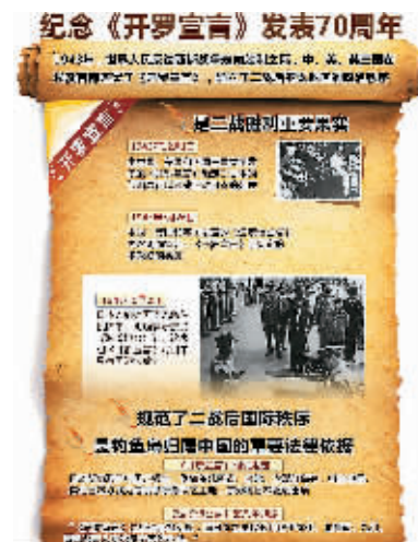
新华社记者 韩宇 周咏缙编制