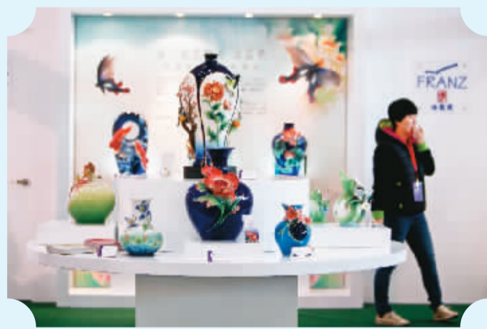
参观者在博览会上参观台湾精品瓷器。

11月21日，为期4天的2013台湾名品博览会在北京中国农业展览馆开幕。本届博览会设有台湾精品馆、智慧生活体验馆、科技应用体验馆等7个展馆，250家企业携近万种台湾商品参展。