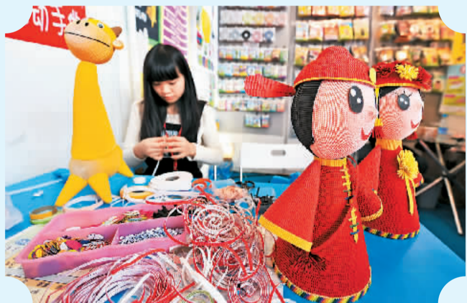
工作人员在博览会现场制作手工作品。

当然，最重要的是，要尽快加强健康教育体系的规范化、制度化建设，让健康教育体系涵盖到政策制定、全社会健康教育文化氛围的营造、专业机构的完善、专业人才的培养等等各个方面，为提高全民健康水平奠定坚实基础。