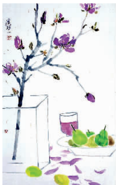
北京之春系列之二（中国画）熊广琴