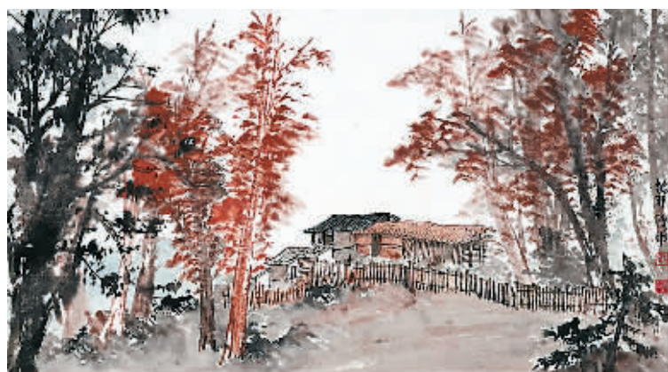
秋景山水横幅 傅申