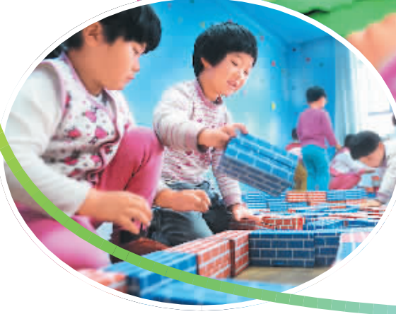
为缓解学前教育发展不均衡、公办幼儿园不足带来的“入园难”,甘肃嘉峪关市从2012年开始,一次性投资6700多万元新建7所城乡公办幼儿园,扩大公办幼儿园“供应量”。