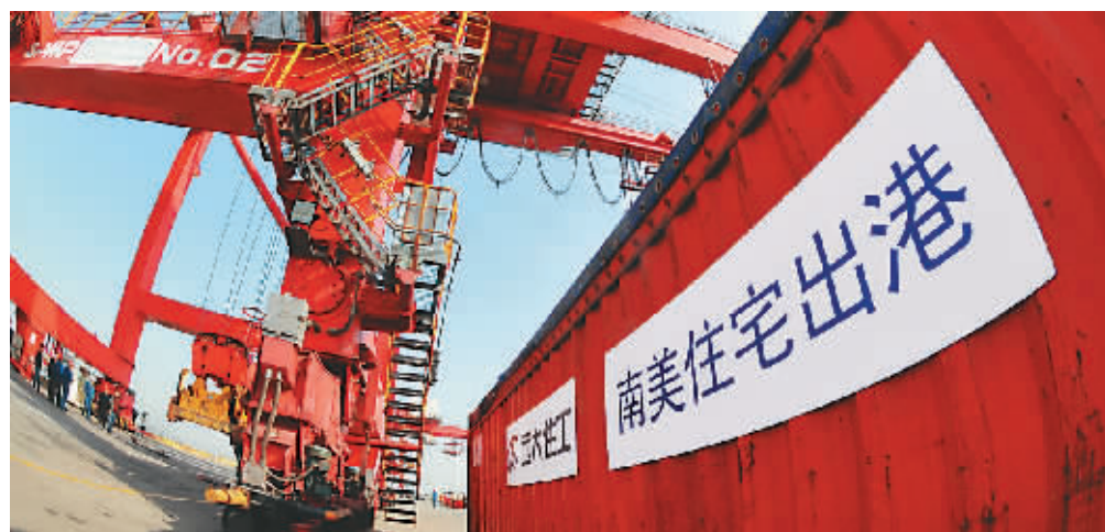
11月18日,由远大住宅工业有限公司生产的成品住宅开始陆续装运往南美洲。该公司将在2到3年内向苏里南出口1.8万套成品住宅。