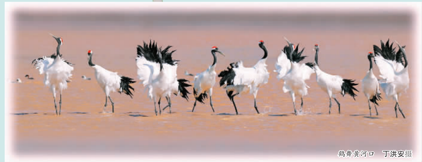
鹤舞黄河口

以“奇、特、旷、野、新”为主要特征的黄河口自然景观和生态旅游资源，为山东东营市迎来了前所未有的发展机遇，“坚持生态优先，实现可持续发展”。2009年11月，黄河三角洲高效生态经济区发展规划上升为国家战略，保护区被列入核心的生态建设与保护区域。