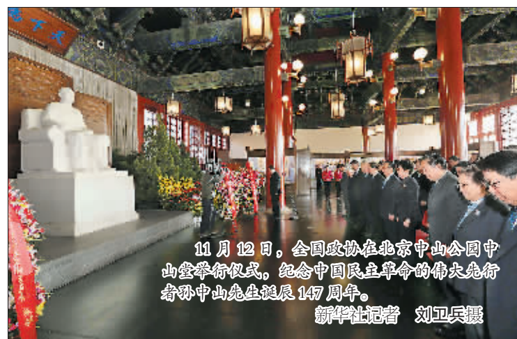
11月12日，全国政协在北京中山公园孙中山堂举行仪式，纪念中国民主革命的伟大先行者孙中山先生诞辰147周年。