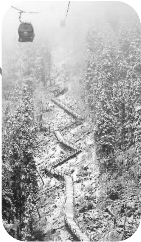
登达古冰山可乘坐的世界上海拔最高的观光索道

“快看，冰山！”远处的冰山山峰在阳光照射下露出了真容。我们在红军桥乘汽车开始走盘山路，窗外的景色悄然发生了变化，彩林逐渐披上了白色的雪花，从山顶到山坡依次渐变。忽然，一片片红色闯入了视线，似乎要冲破白雪的覆盖。进入红叶