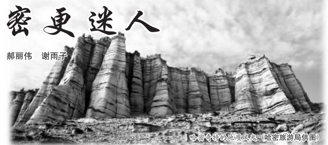
哈密奇特的地质风光。

险感。周围全是光怪陆离、有点恐怖的巨石，总感觉自己在探秘几千年前，想起来都很刺激。”游客张先生对笔者说道。哈密魔鬼城是迄今为止世界上规模最大、地质形态发育最成熟、最具观赏价值，曾经建有古驿站的雅丹地貌群落，特别是进入冬季，整个魔鬼城堪称一座梦幻世界。