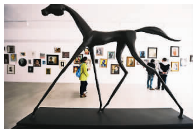
“我们：1994—2013——中国宋庄艺术家集群二十周年纪念特展”一瞥

据悉，有近1500位宋庄艺术家参与本届艺术节，成为史上参与人数最多的一届宋庄艺术节。此前举办的宋庄文化艺术节多采用聘请外地策展人的制度，本届艺术节则由宋庄本地艺术家来承担策展人一职，让艺术节更具浓郁的“宋庄味道”。