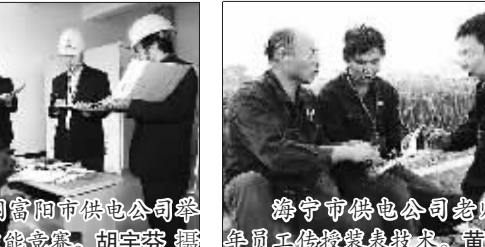
海宁市供电公司老师傅给青年员工传授装表技术。