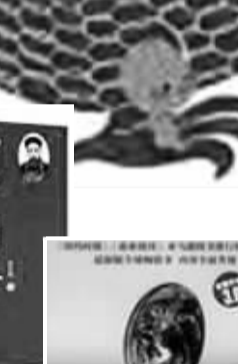
《激荡三十年——中国企业1978—2008》有一个人群，在1978—2008年...