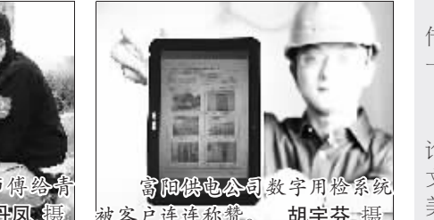
富阳供电公司数字用电系统被客户连连称赞。