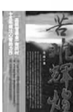
《苦难辉煌》是一本军事小说。书中描写的...