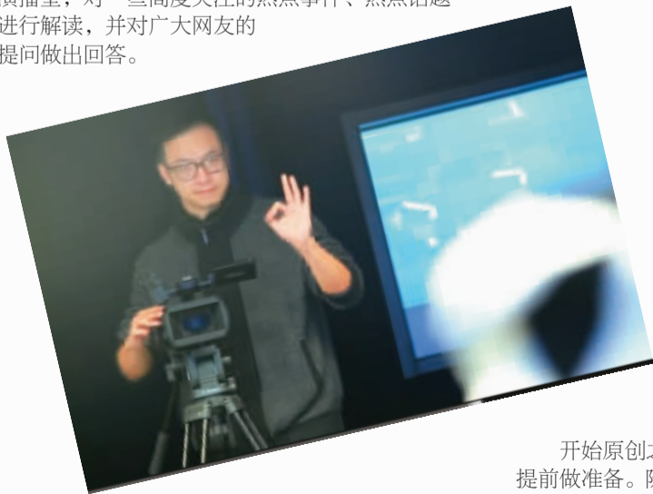
海外网视频原创节目录制现场

《海外网·焦点对话》是海外网视频频道首次重磅推出的原创网络视频访谈节目。节目围绕“关注时事报道，聚焦热点问题”的主旨，邀请在不同领域有影响力、知名度的嘉宾来到海外网精品演播室，对一些高度关注的热点事件、热点话题进行解读，并对广大网友的提问做出回答。