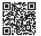
扫描二维码浏览更多周年内容