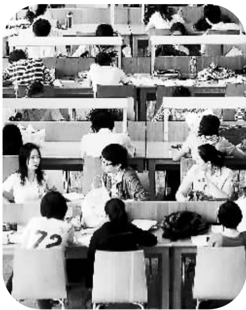
图书馆读书的深圳市民。