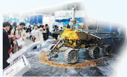
“月球车”首次亮相“工博会”。

本报上海11月5日电(记者励漪)“月球车”和“神十”返回舱相携而来,机器人王国“四大家族”巅峰对决,3D打印机从义齿打到飞机零部件……今天在沪开幕并展至9日的第十五届中国国际工业博览会上,各种先进的高端装备和制造技术齐齐亮相,争奇斗艳。