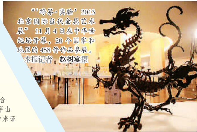
“跨界·实验”2013北京国际当代金属艺术展11月4日在中华世纪坛开幕,20个国家和地区的458件作品参展。