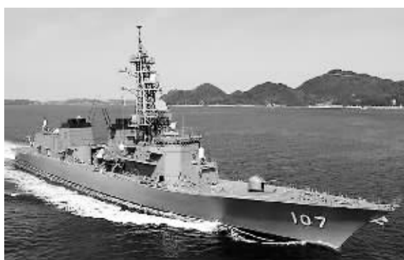
图为日本海上自卫队DD-107舰，舰名为“雷”，隶属于日本海上自卫队第1护卫队群。该舰于10月25日10时41分强行闯入中方演习区，并长时间滞留，直至28日7时32分才离开。

安倍正在头脑发热地做着武士梦，但这种倾向只会让事情变得更加糟糕。军事和经济捆绑的时代早已成为过去。日本不应该选择否定历史问题而受到孤立。对一个陷入经济泥沼的日本来说，经济上对邻国的需要远远要超过敌意。人们更关心的是经济，而不是武力。