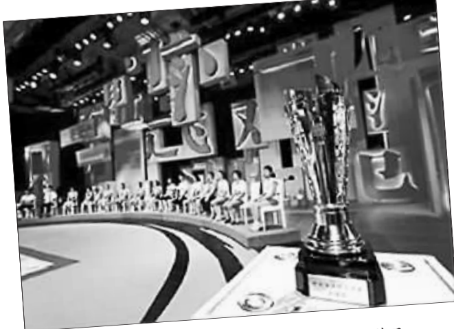
《中国汉字听写大会》成了今夏最具话题性的节目。

她喜欢网游和漫画，有一颗典型的理科生脑袋，却在《中国汉字听写大会》总决赛上夺冠。就是这个语文成绩曾排名中下、最后一个被招入参赛队、自称“最没存在感”的女孩，跑到了最后——