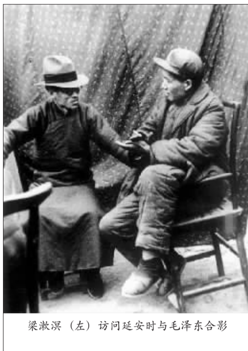
梁漱溟（左）访问延安时与毛泽东合影

抗战胜利后，在大家的推举下，梁漱溟担任了民盟秘书长，再次为实现国内和平统一而奔忙，倾情投入到国共两党的调停之中。但是蒋介石却将停战协定扔在一边，制造“李闻惨案”，并随后在一两个月时间占领了解放区的多座城市。至此，梁漱溟认识到了和平谈判的失败。梁漱溟和民盟所代表的中间力量抱着真诚的想法和迫切的心情希望能够阻止内战，走向和平，但是理想很快被现实撞得粉碎。此后几年，梁漱溟隐退在重庆北碚，闭门著书。