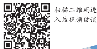
扫描二维码进入该视频访谈

海外华文媒体正进入全媒体时代。我认为，华文媒体可以适当建立合作伙伴的稿件平台，开发专门软件，各合作者可以第一时间在平台上互看稿件、图片、版面、视频，免费相互选用，真正做到资源共享、共同发展。