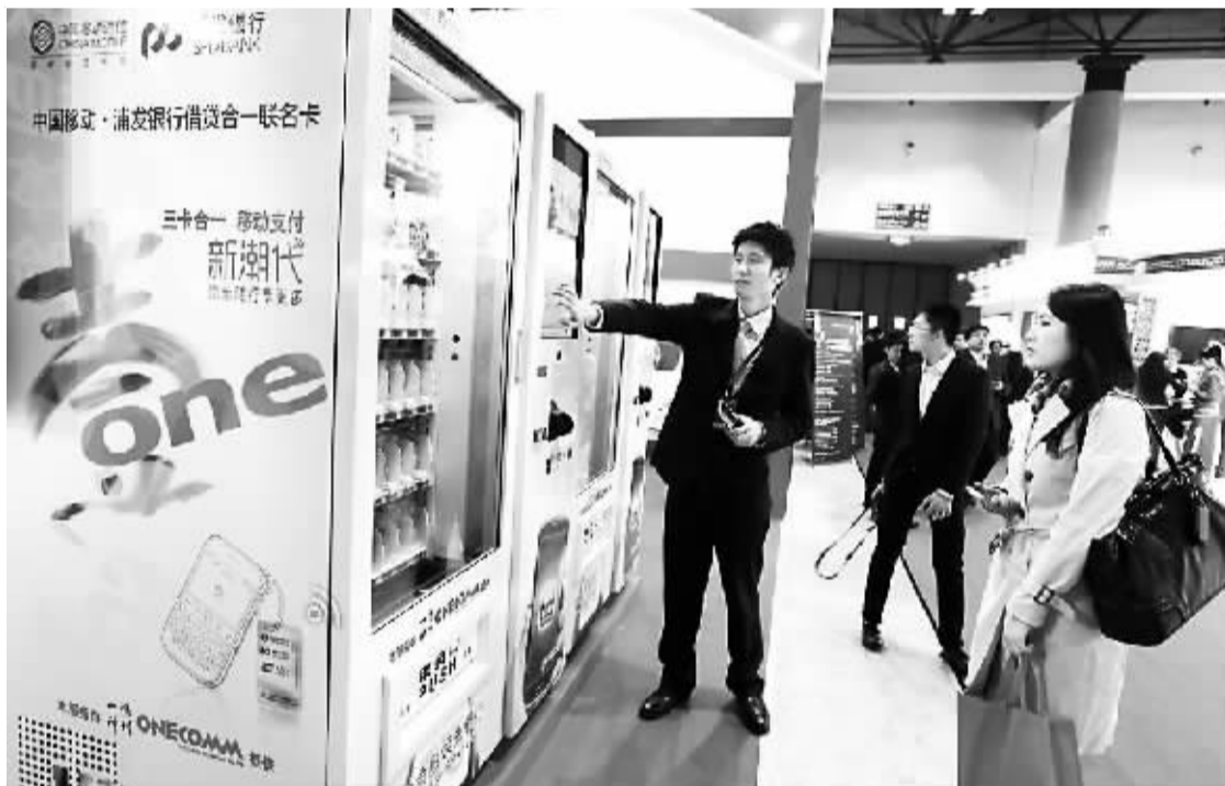
上图:一名工作人员向参观者介绍自动售货机手机移动支付。右图:金融博览会上一家银行的展台摆放“嫦娥3号”月球车模型来宣传探月题材贵金属产品。