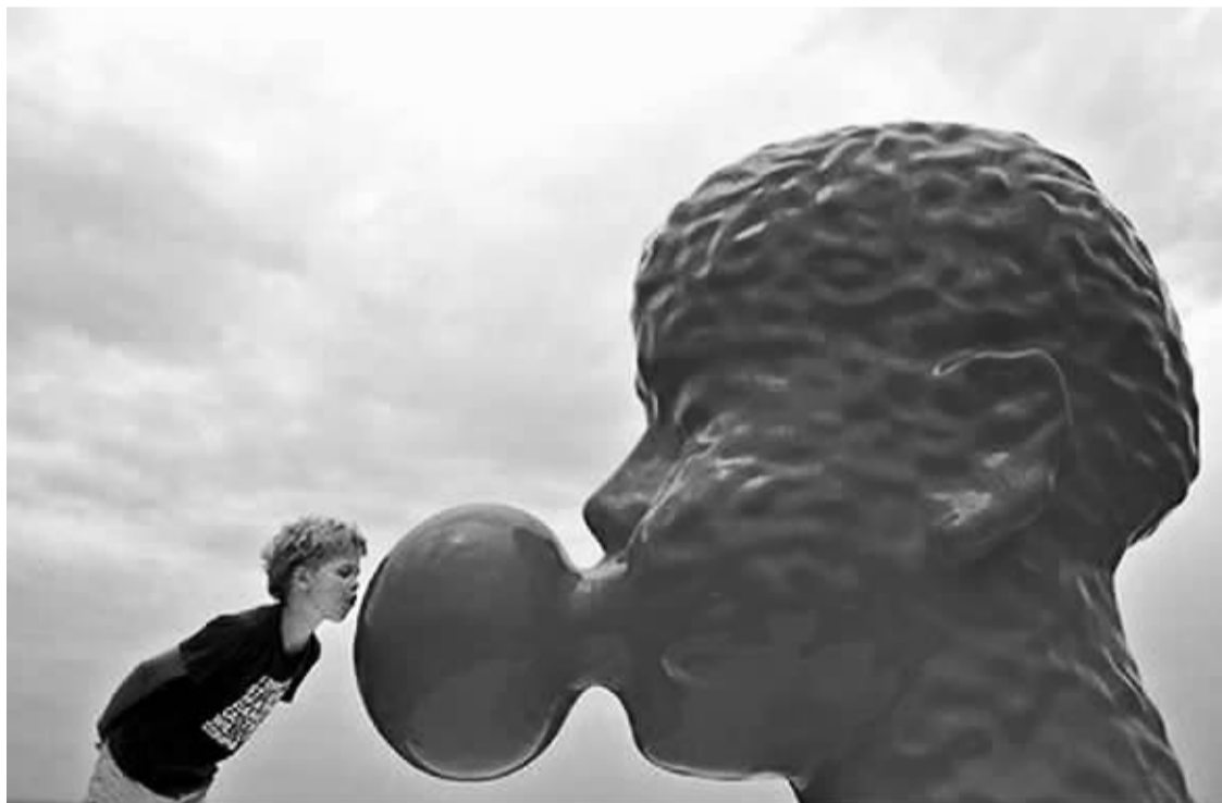
在日前举办的澳洲悉尼海滩雕塑展上，华人艺术家钱斯华(Qian Sihua, 音译)制作的一尊2米高的血红雕塑，屹立在悉尼的南邦迪(South Bondi)海岬之上。这个“嚼着口香糖的人头”，赚足了回头率。