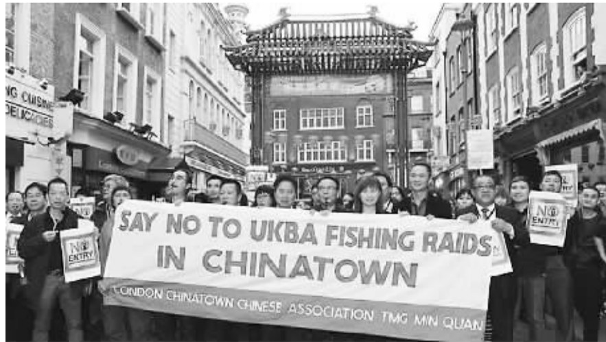
图为伦敦中国城华商举行罢市，抗议英国边境管理局的“撒网式搜捕行动”。

此外，华商理应先了解法律知识，在知法守法的前提下，用法律武器来保护自己，规范用工，同时保护自身的合法权益。