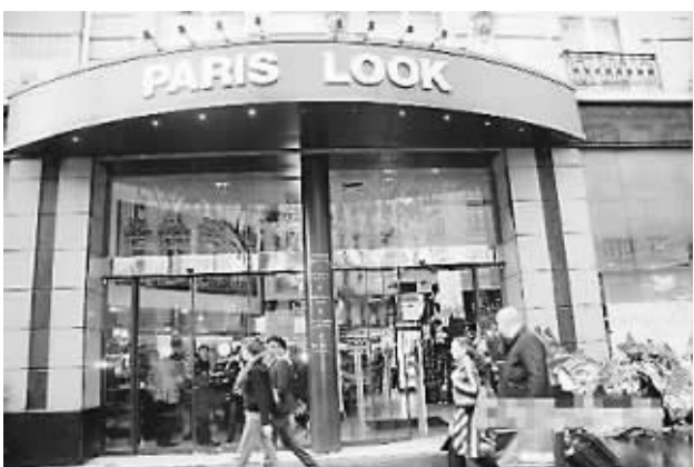
图为华裔奢侈品旗舰店“巴黎形象”

中国经济稳健运行、新兴经济体活力蓬勃、发达经济体趋于转暖，这是游走世界华商的“天时”；包括TPP、RCEP在内的多个国际经贸框架对投资给予欢迎和政策扶持，这是华商的“地利”；华商群体走向年轻化、高学历化，思维活跃、投资意愿强烈，这是华商的“人和”。三者兼备，打造华商旗舰正当其时。