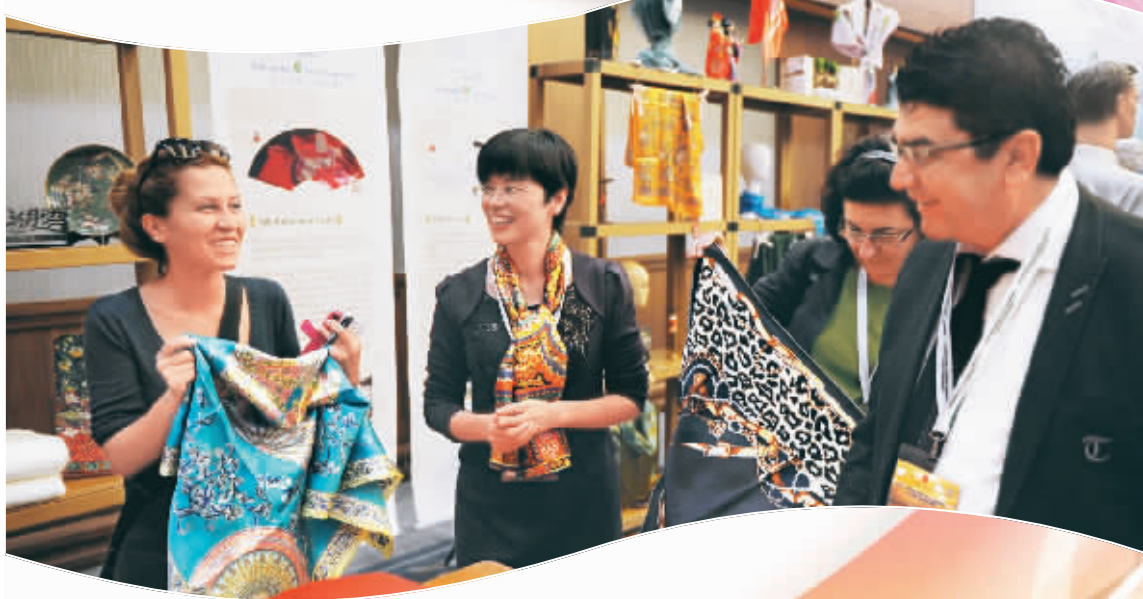
▲中国苏州丝绸艺术家在展示丝绸技艺。

10月28日,丝绸之路国际研讨会在伊斯坦布尔召开。阿富汗、阿塞拜疆、格鲁吉亚和土耳其等17个国家的政府官员及400多名专家学者出席大会。在为期3天的丝绸之路国际大会中,中国苏州市政府还举办了“中国丝绸展”,推出6大类228个丝绸制品,集中展示了中国丝绸发展的悠久历史和丝绸文化的深厚底蕴。