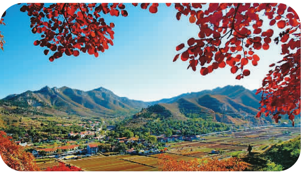
仰天山秋色