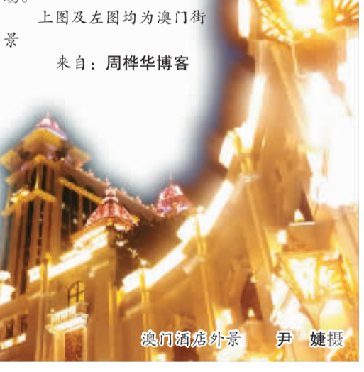
上图及左图均为澳门街景

目前,赴澳门旅游的游客中仅有一成左右是国际客源。要打造世界旅游休闲中心,澳门亟待开拓国际客源市场。据介绍,经过10多年发展,目前,来澳门的韩国游客已有大幅增长。不久前,澳门旅游局还首次在俄罗斯莫斯科设立了代表处,以进一步开发莫斯科和俄罗斯远东地区的客源市场。