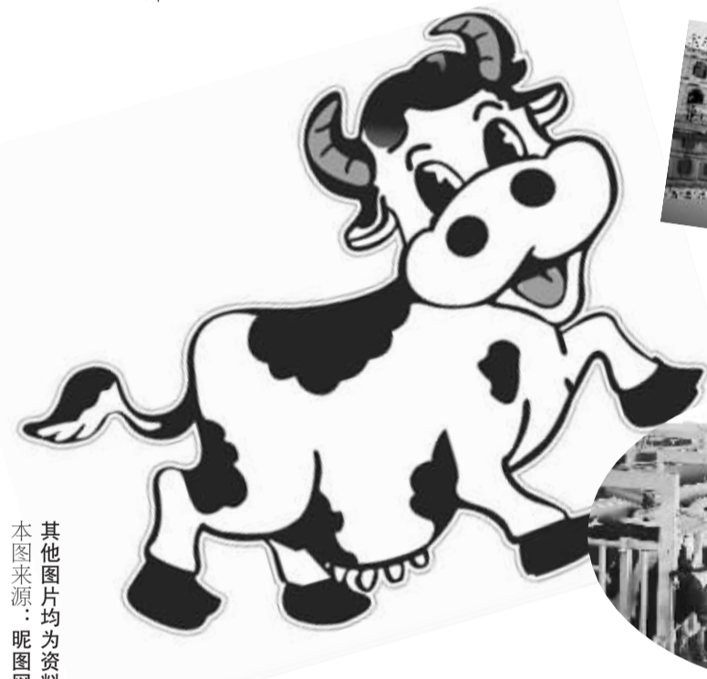
其他图片均为资料图片