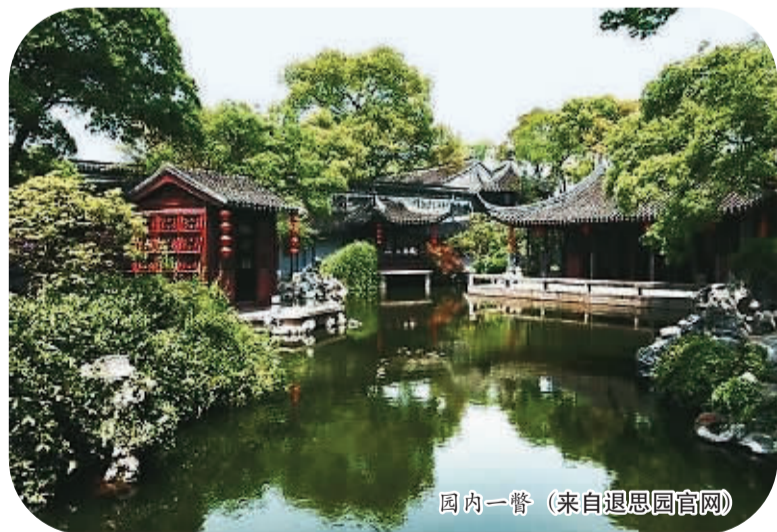
园内一瞥

园中格局紧凑,但丝毫不失大气灵动之美。讲解员说,大气是因为晚清江南园林建筑风格是以古朴无华、素静淡雅的风格为主;灵动是因为整个园林以水为中心,山、亭、堂、廊、轩、榭、舫皆紧贴水面,园如出水上,可谓独秀江南。据了解,退思园是采用横向结构手法建