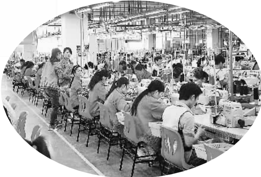
图为云南某外资玩具公司整洁现代的生产加工车间。

随着对外开放脚步的加快，云南省引进利用外资的规模迅速增长。据统计，自1984年第一家外资企业落户云南以来，云南已累计批准外商投资企业4000户，利用外资规模突破100亿美元。在外商投资规模快速增长的背景下，外资企业在云南的生存状况如何？不久前，云南省外商投资企业联合年检报告出炉，通过对2012年度云南1231户参检外资企业出资、税收、经营、就业等数据综合分析，勾勒出在滇外资企业的基本生存状况，也为进一步扩大招商引资，服务引导企业揭示了方向。