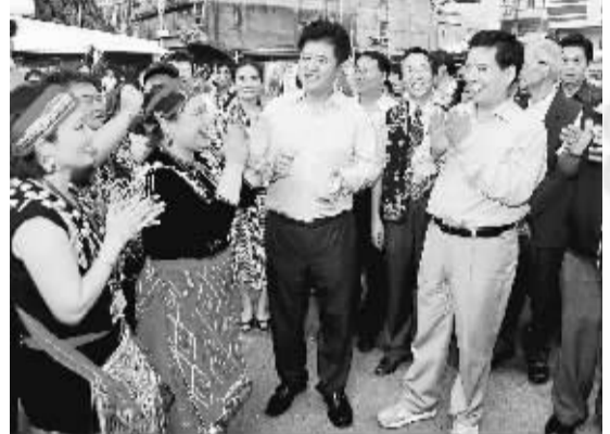
秦光荣等来到桃园县忠贞新村看望云南乡亲

“秦光荣书记一行长途奔波，日以继夜开展工作，很辛苦、很真诚、很平和、很实在，给台湾各界留下了深刻印象。”蒋孝严表示，中国国民党愿意为推动云台交流合作积极贡献力量，共同增进两岸民众福祉。