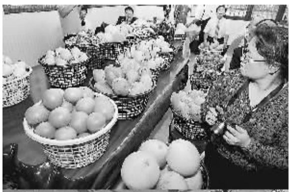
嘉义县水上乡特色农产品 琳琅满目

在台期间举办的云台高原特色农业交流会、教育研讨会、生物科技合作对接会、金融同业合作座谈会、旅游业界联谊会、美丽云南图片展等活动异彩纷呈，为参访