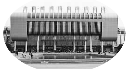
螺蛳湾国际商贸城

有着大量的需求。据越南最新市场调查报告称，今年上半年，越南、新加坡、马来西亚、印度尼西亚和泰国等东南亚地区小家电需求大幅增加。同时，自2001年启动东盟自贸区建设迄今的10年间，东盟地区经济飞速发展。今年3月举办的义—东盟经贸合作对接会，为义乌小商品走向东南亚、南亚架桥铺路。此次义乌与昆明螺蛳湾国际商贸城进行商贸对接，无疑是中国小商品进入东盟市场最便捷方式。同时，两个企业的对接不仅搭建起两个城市合作的桥梁，也为中国小商品行业“走出去”、“走得远”创造了现实可能。