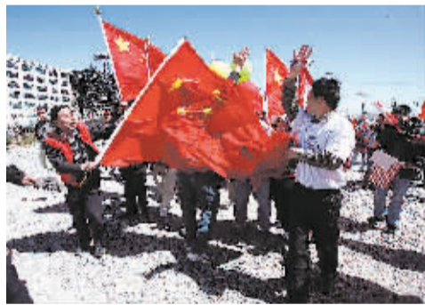
挥旗捍卫奥运圣火