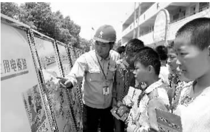
▲9月1日,扬中中心小学请来了供电公司员工为同学们讲解电力安全知识。活动中,他们通过给孩子们上安全课、开设图片展、发放宣传手册、播放宣传片等形式介绍了安全用电常识、节约用电窍门、能源环境保护等方面的知识。同学们回家后给父母和其他小朋友介绍用电常识,做个安全用电小讲师。(薛文)