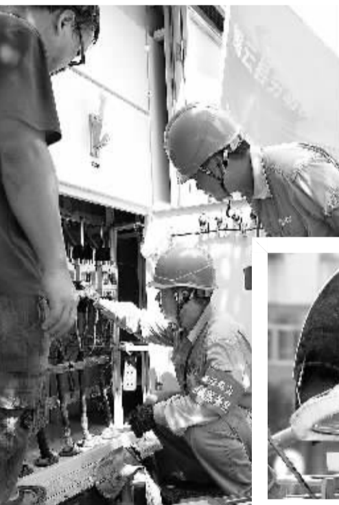
▲国网浙江供电公司“及时雨”劳模服务队日前到东渡中学等学校,义务检修用电设备、线路。为校园撑起安全用电保护伞。“及时雨”劳模服务队重点对教室、宿舍、办公室、配电室内用电设施进行全面巡视和检查。对不能现场处理的与学校领导沟通,及时解决用电隐患问题,以保证学校开学后能正常安全用电。(李森 朱礼平)

“应急联动”受表扬:9月10日,象山公司再度成为唯一一家受到县双联中心通报表扬的单位。象山公司始终坚持规范运营,在应急处置工作中,不仅做好本职工作,还积极配合协助县相关部门,并向县双联中心执行两次汇报制度。今年圆满完成现场处置367起,受到了县委、县政府的一致肯定。公司将持续开展应急联动等新型多样的电力设施安全保护活动,从加强巡视、科技强防、警企联动、广泛宣传等多方面,推动电力设施安全保护工作深入开展,营造良好的社会氛围。(董玉燕)