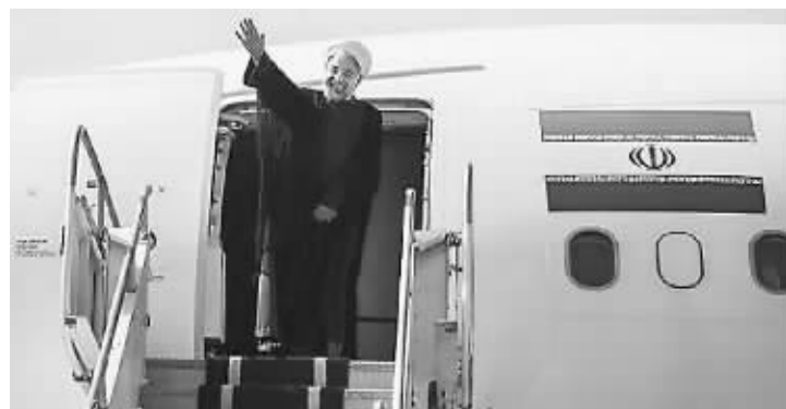
24日,伊朗总统鲁哈尼抵达纽约,出席联合国大会。