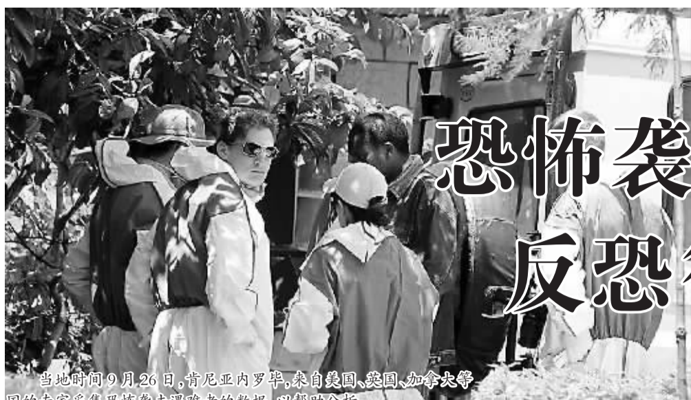
当地时间9月26日,肯尼亚内罗毕,来自美国、英国、加拿大等国的专家采集恐怖袭击遇难者的数据,以帮助分析。