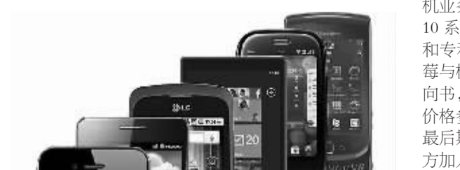
图为苹果、黑莓等多款智能手机。

对于黑莓手机的未来发展,看衰者众多,私有化或将无法改变黑莓的颓势。分析师布莱恩·科尔罗认为,无论哪个潜在买家最终参与竞争,他们可能都不会对黑莓的手机业务感兴趣。他说:“黑莓10系统已经没有任何价值。现金和专利才是黑莓的价值所在。”黑莓与枫信金融控股公司签订收购意向书,不仅给潜在的竞购方提供了价格参照,同时也表明了争夺黑莓的最后期限。未来几周是否还会有竞购方加入,目前还不得而知。