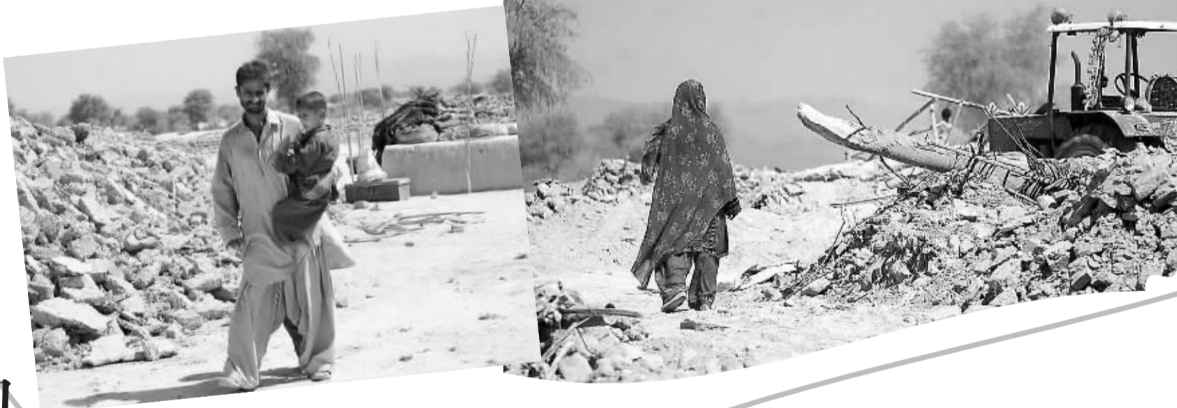
左图为巴基斯坦抱小孩的灾民

巴基斯坦官方25日说,截至目前,西南部俾路支省24日下午发生的7.7级地震已造成328人死亡、超过500人受伤。