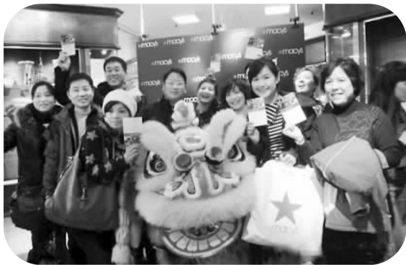
中国“千人游客”团的部分游客在美国纽约曼哈顿。

“2012年,中国的出境旅游占整个国际旅游6%左右。”杜江表示,中国游客对出境旅游的需求越来越大,未来中国游客对出境旅游业的贡献将会很大,占全球旅游人次的比重也将大大提升。目前,中国居民人均出游率达到2次,旅游业增加值占到GDP的4%以上,中国已经形成世界上最大的国内旅游市场,中国旅游业对全球旅游业的贡献率超过30%。