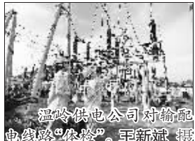
温岭供电公司输电线路“体检”。