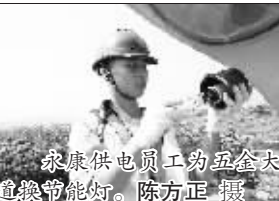
永康供电公司员工为鑫鑫大道节能灯。