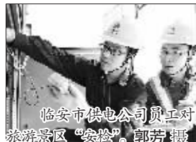
临安市供电公司员工对珠岙景区“会诊”。

9月5日，在杭州临安青山湖科技城大园路上的20组首批安装的智能风光互补路灯接受“手术”，为提高路灯续航能力，国网浙江临安市供电公司路灯管理所将根据运行数据进行改造。根据试运行阶段采集的数据分析，每组路灯每年可节约用电1606度。