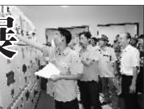
杭州余杭区首座两兆瓦光伏电站运行，拉开新能源进入余杭序幕。

百矿下属靖西县锰矿公司年产锰矿120万吨，远景可采储量约4500万吨，是全国主要的碳酸锰生产基地，已初步形成采、选、冶、炼、精深加工一体化发展的产业集群，将开发建设产业园区，构建锰产业生态循环全产业链。百矿煤机项目以“三机一架”成套综采、综掘设备和配