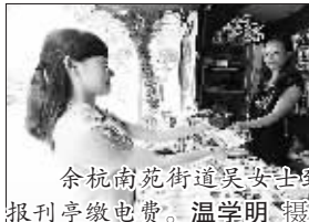
余杭南苑街道吴女士到报刊亭缴电费。