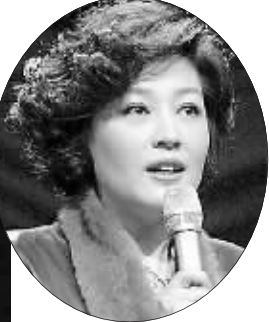
哈文：负责《开门大吉》、《黄金 100 秒》等节目，央视龙年、蛇年春晚总导演

继 2013 年推出《舞出我人生》、《开门大吉》、《黄金 100 秒》等数十档全新的综艺节目，同时对《星光大道》、《梦想合唱团》等品牌栏目进行改版升级后，明年央视将继续加强对综艺节目的改革、创新和开放。台内以哈文、许文广、毕福剑、过彤为代表的综艺新势力，与灿星、唯众等社会制作力量全面合作，推出更多全新的综艺节目：选秀类节目《功夫好男儿》中，梅花桩、十八般武艺、轻功、少林武当等各项绝技，将结合综艺秀方式在舞台上一一呈现，节目还将邀请成龙、冯小刚坐镇导师席，选拔未来的功夫之王；《梦想星搭档》中，参加的歌手包括齐秦、齐豫、杨宗纬、沙宝亮等，他们将采取音乐搭档的组合形式，现场演唱经典歌曲进行比拼，为孩子们公益梦想而奋斗；《幸福账单》将邀请普通人讲述手中账单背后的故事，并参与为其量身定制的大型游戏，以赢得账单报销的形式，展现了当今百姓生活中的幸福之态；2014 年，《谢天谢地你来啦》也将推出选秀节目《喜剧王》，从草根中发现真正的喜剧之王。