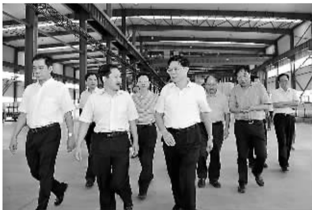
市委书记贺安杰（前排右一）调研新开工产业项目

天时、地利、人和，成就了这片“福地”独特的光彩和魅力，赋予这座城市崇尚成功、包容失败的自由宽松的创业文化品性，并由此演绎出一个个充满激情与梦想的创业传奇。