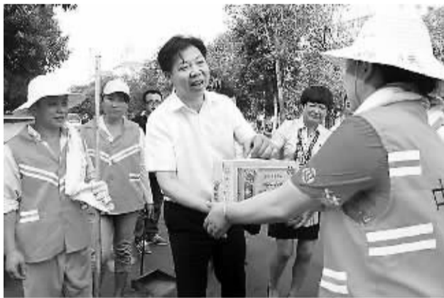
市委副书记、市长毛腾飞慰问社区环卫工人