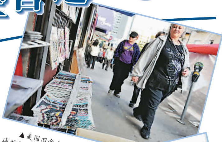
▲美国旧金山中国城的报摊上的华文报纸

中日关系再度恶化,主要因为2012年9月10日日本对钓鱼岛实施所谓“国有化”。一年后的今天,东海局势依然紧张。一方面,9月8日,中国海军两架轰-6轰炸机飞经冲绳主岛和宫古岛之间的海域上空赴西太平洋进行训练,日本航空自卫队战机紧急升空应对。9日,中国军队在东海有关海域组织例行性训练。另一方面,安倍在9月9日声明:“绝不会在主权问题上让步。”10日,内阁官房长官菅义伟又称,将“坚决守卫,毅然对应,绝不让步”。日本当局甚至下达“对中国特别警戒令”。