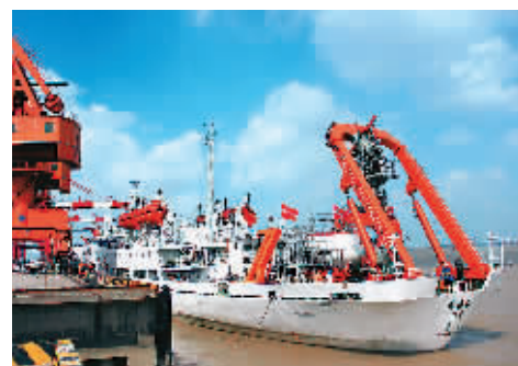
图为搭载“蛟龙”号载人潜水器的“向阳红09”号综合补给船在江阴市苏南国际码头缓缓停泊。

9月19日，完成科考任务后的“蛟龙”号载人潜水器搭乘母船“向阳红09”顺利返航。2013年试验性应用性航次是“蛟龙”从冲击深度的海试转向试验性应用的“处女航”。6月10日起航以来，“蛟龙”号圆满完成了3个航段21次下潜，从深海带回了珊瑚、海参、海葵等71种共390只生物、161枚结壳、8块结壳、32块岩石和180公斤沉积物等样品。