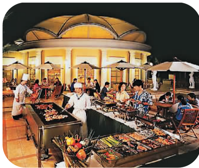
台湾民众中秋烤肉