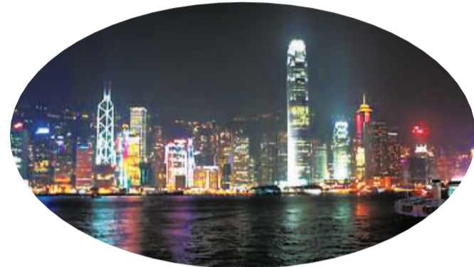
香港维多利亚港湾夜景

舞火龙,是香港中秋节最富传统特色的习俗。从每年农历八月十四晚起,铜锣湾大坑地区就一连3晚举行盛大的舞火龙活动。火龙长近70米,用珍珠草扎成32节的龙身,插满长寿香。盛会之夜,大街小巷里蜿蜒起伏的火龙在灯光与鼓音下欢腾起舞。舞毕,居民拔下火龙身上的线香分派给围观者。据说取得线香的人会交好运,所以,那几天巷子里等候“好运”者人满为患。