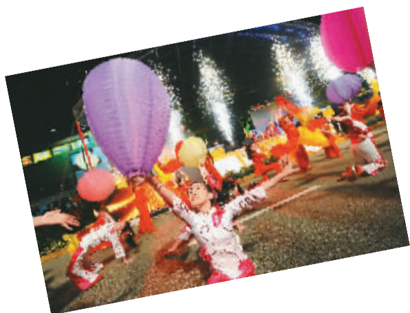
9月7日,在新加坡牛车水华人聚居区“点亮世界共庆中秋”亮灯仪式启动。