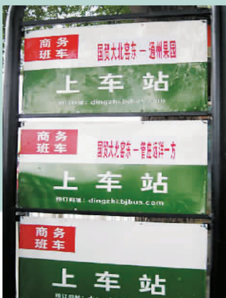
定制公交国贸站牌