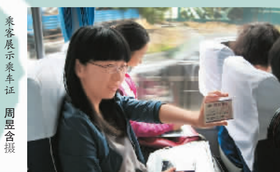
乘客展示乘车证