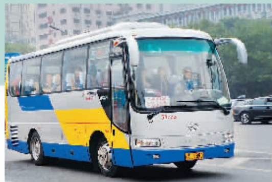
定制公交外外观