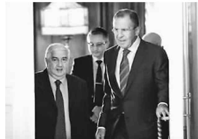
俄外交部长拉夫罗夫(右)与叙外长举行新闻发布会

在美国国内反战呼声越来越高的背景下，俄罗斯这一提议，看似也在给奥巴马“台阶”下。奥巴马或进或退，是时候落棋了。