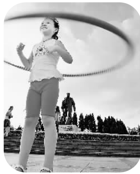
▲二〇〇六年莲花山玩呼啦圈的少女

歌词创作成绩，让大器晚成的词作家蒋开儒收获了很多荣誉：中宣部“五个一工程奖”、中国金唱片奖、文华奖、解放军文艺奖、中国广播文艺奖、电视文艺星光奖等国家级大奖、深圳市文明市民、深圳市优秀专家等。在一次全国群众歌曲创作研讨会上，中国音乐家协会主席傅庚辰说：“新中国成立以来，出现了3首里程碑式的歌曲，即《歌唱祖国》、《春天的故事》、《走进新时代》，从这个角度来说，蒋开儒当之无愧是人民艺术家。”