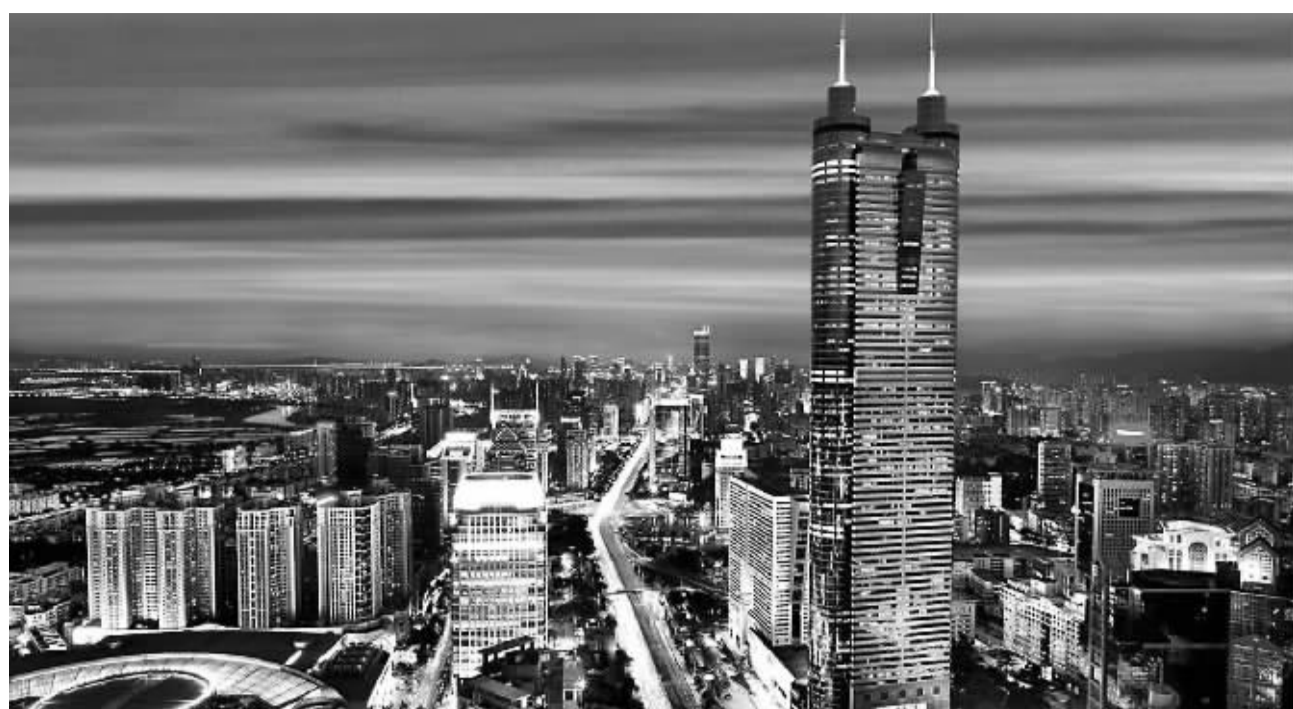
▲30岁的深圳，而立之年的城市