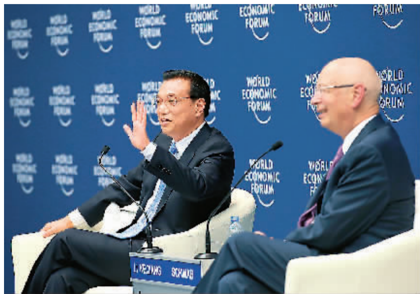
李克强同中外企业家代表对话交流。