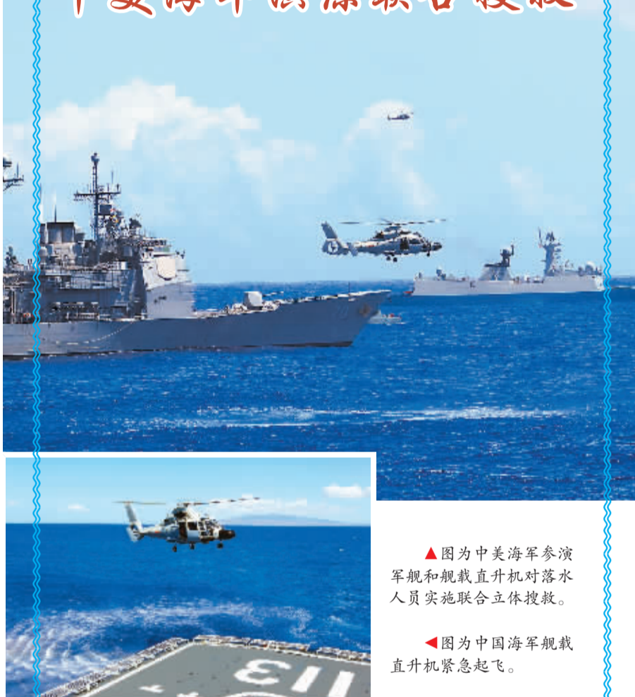
▲图为中美海军参演军舰和舰载直升机对落水人员实施联合立体搜救。