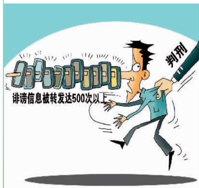
朱慧卿作