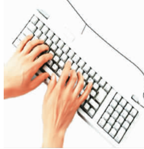
蒋跃新作

值得注意的是，利用网络进行犯罪，有可能同时构成其他犯罪。孙军工举例说，上面提到的网络犯罪，还有可能触犯损害商业信誉、商品声誉罪等罪名，对此，《解释》规定此类行为将依照处罚较重的规定来定罪。